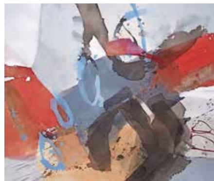
Bildtitel: „Kräftespiel“